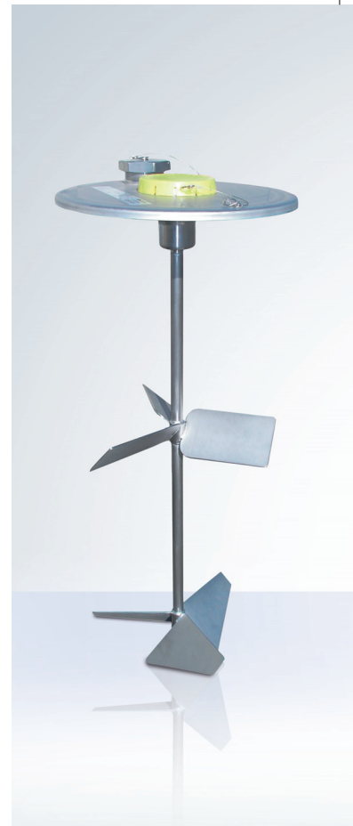
Смеситель UCON IBCz для растворов. Смеситель для очистки.