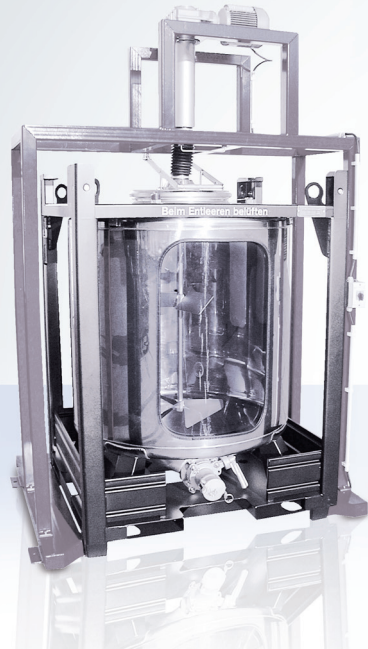
Станция перемешивания UCON IBCz предназначена для кубических и цилиндрических контейнеров и оборудована специальным приводным валом для компенсации отклонений.