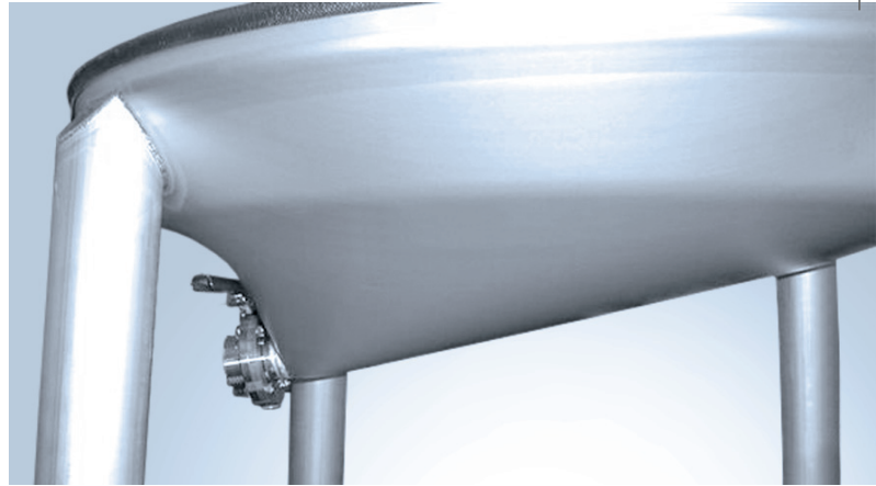
Днище и выходной желоб сконструированы из единого металлического куска. Это способствует выгрузке продукта без задержки.