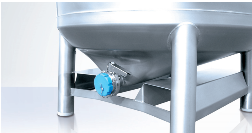
Специальная форма обеспечивает легкий выход продукта и легкую мойку.